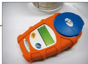
Obr. 4 – Digitální refraktometr s rozsahem měření 0 až 56 % Brix (hodnoty 0.0 – přístroj je nakalibrován a připravený k hodnocení kvality mleziva)