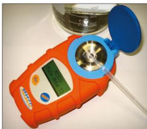
Obr. 3 – Digitální refraktometr se před použitím kalibruje vodou (pitnou kohoutkovou, destilovanou), což trvá do pěti sekund