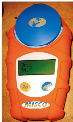
Obr. 6 – Mlezivo vhodné pro první a následné napojení telete ( \geq 22 % Brix)