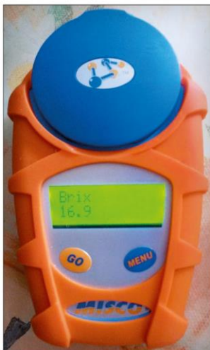
Obr. 5 – Mlezivo nízké kvality, které není vhodné k prvním dvěma napojení telete ( \leq 22 % Brix)