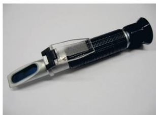
Obr. 1 – Ruční optický univerzální refraktometr s rozsahem měření 0 až 32 % Brix

Nizká kolostrální imunita patrná z nedostatečné koncentrace sérových imunoglobulinů (Ig), zejména pak Ig třídy G, které tele přijalo z mleziva, má za následek vyšší nemocnost a úhynny telat před odstavením, což má velmi negativní vliv i na jejich další vývoj a celkovou ekonomiku chovu. Stav, kdy koncentrace sérových IgG je <10 mg/ml (minimální požadovaná hladina), se mezinárodně označuje jako selhání pasivního přenosu imunity (SPPI). SPPI v chovech způsobuje jak krátkodobé, tak i dlouhodobé ztráty (nižší intenzita růstu telat, jejich vyšší nemocnost, vyšší náklady na léčbu a spotřebu veterinárních léčiv, zvýšení